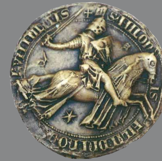
Sceau équestre de Miles X de NOYERS apparaissant sur la charte qui a affranchi les habitants de Vendevre en 1341.